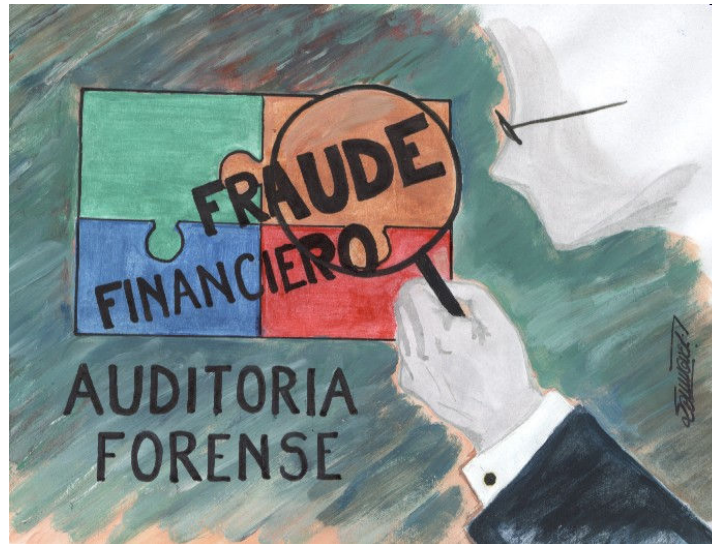
Gráfico: Auditoría Forense. 1

“Más que una especialidad profesional una misión: prevenir y detectar el fraude financiero”